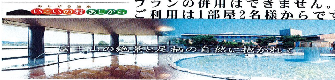
富士山の絶景と足柄の自然に抱かれて